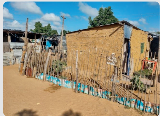
Foto 2 Vivienda hecha de barro asentamiento Arroyo La Voz Que Clama 16/01/2023