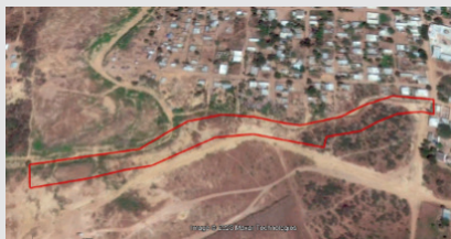
Imagen satelital 1 de enero del 2018