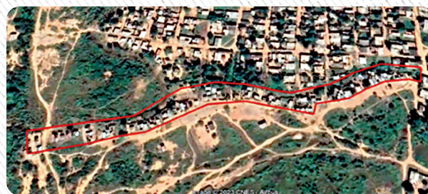
Polígono del asentamiento. Teledetección. 28/02/2022