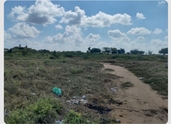
Foto 10 Predio privado donde se realiza la defecación a campo abierto - Arroyo La Voz Que Clama 16/01/2023

Coordenadas 11,37301; -72,267216 Punto de vertimientos.