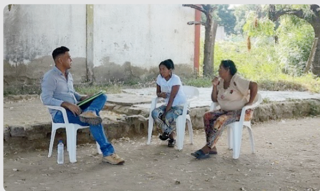
Foto 16 Reunión de apertura Diagnóstico de necesidades WASH Arroyo La Voz Que Clama 16/01/2023