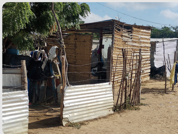
Foto 19 Vivienda del asentamiento Arroyo La Voz Que Clama 16/01/2023