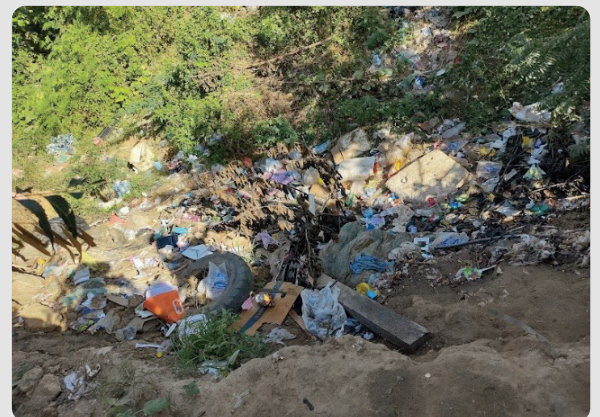
Foto 12 Área donde se realiza la defecación los niños y niñas a campo abierto - Arroyo La Voz Que Clama 16/01/2023

Las aguas resultantes son vertidas al suelo o al arroyo.