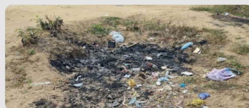
Foto 15 Prácticas de quema de residuos sólidos en Arroyo La Voz Que Clama 16/01/2023