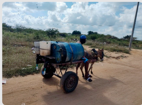
Foto 7 Principal forma de suministro del agua Arroyo La Voz Que Clama 16/01/2023

Quienes entregan el agua a veces son personas del mismo asentamiento que diariamente alquilan el vehículo y el animal.