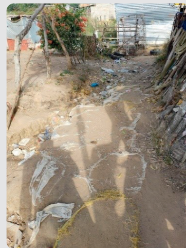
Foto 5 Zona de inundación en arroyo del asentamiento Arroyo La Voz Que Clama 16/01/2023

Estos aspectos generan un ambiente de riesgos para la salud.