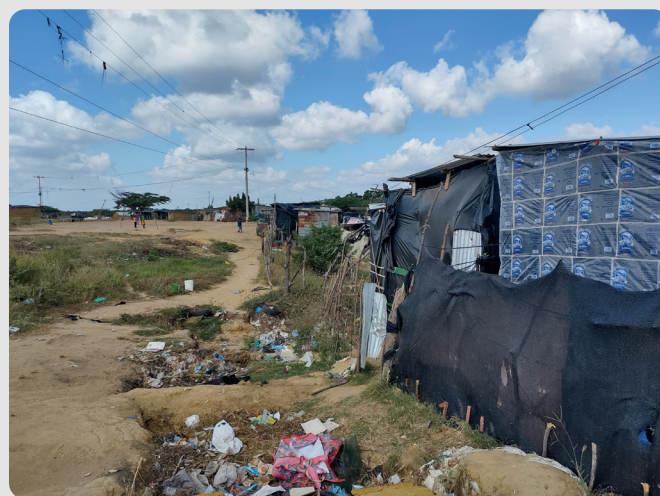
Foto 18 Alrededores del asentamiento Arroyo La Voz Que Clama 16/01/2023