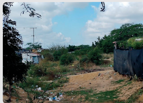
Foto 4 Canal del asentamiento Arroyo La Voz Que Clama 16/01/2023

En temporada de invierno las escorrentías alimentan el canal produciendo inundaciones.