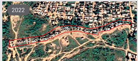
Imagen satelital 23 de diciembre de 2022

En las imágenes se observa que en 2016 no existía ninguna edificación en el área del arroyo, en 2018 aparecen tres núcleos de viviendas separados entre sí, uno más habitado hacia la derecha, y otros dos apenas apareciendo, y en 2022 es evidente la alta densificación, conformándose un solo asentamiento alargado, en una línea de viviendas en la margen del arroyo.