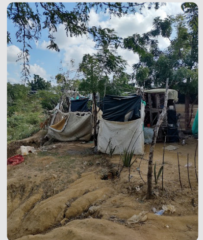
Foto 11 Áreas improvisadas para la higiene personal - Arroyo La Voz Que Clama 16/01/2023

Las casas tienen áreas improvisadas para la higiene personal con canecas de agua, ubicadas a la orilla del canal, las aguas resultantes son vertidas al arroyo incrementando el riesgo de deslizamiento.