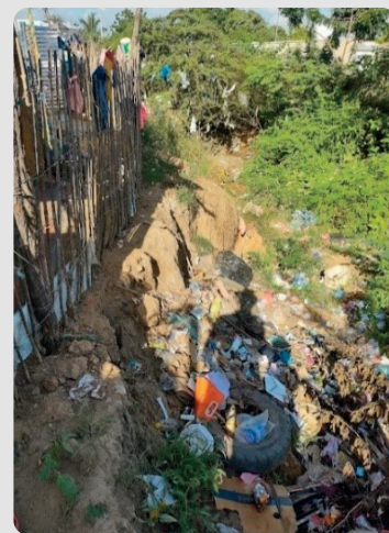
Foto 6 Riesgo de deslizamiento en arroyo del asentamiento Arroyo La Voz Que Clama 16/01/2023

Se han presentado hurtos y atracos a la población en altas horas de noche. (Información líder comunitario).