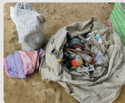
Foto 14 Materiales reciclables para su comercialización Arroyo La Voz Que Clama 16/01/2023

Coordenadas 11,373504; -72,267676 Lugar de quema incontrolada de residuos