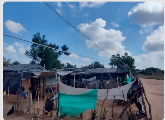
Foto 3 Conexiones eléctricas no autorizadas Arroyo La Voz Que Clama 16/01/2023