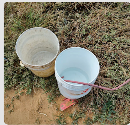
Foto 9 Baldes de recolección de agua Arroyo La Voz Que Clama 16/01/2023

El agua se utiliza principalmente para beber y preparación de alimentos.