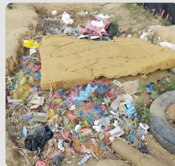
Foto 13 Residuos sólidos dispersos en áreas abiertas al Arroyo La Voz Que Clama 16/01/2023

Se observan muchos residuos dispersos por el asentamiento, de diversas características y materiales.