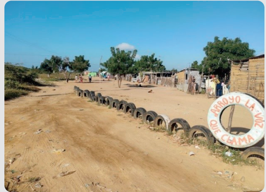
Foto 1 Entrada del asentamiento Arroyo La Voz Que Clama 16/01/2023