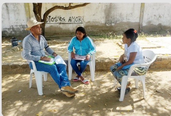
Foto 17 Reunión de cierre Diagnóstico de necesidades WASH Arroyo La Voz Que Clama 16/01/2023